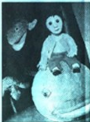
Un chef-d'œuvre d'investivité.